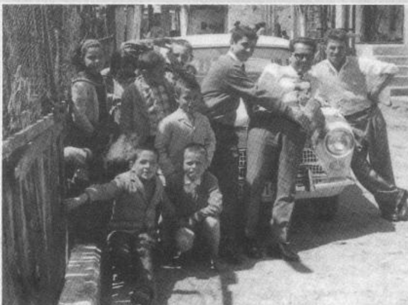
Πάσχα στη Πάνω-Ρούγα τη δεκαετία του 1960.