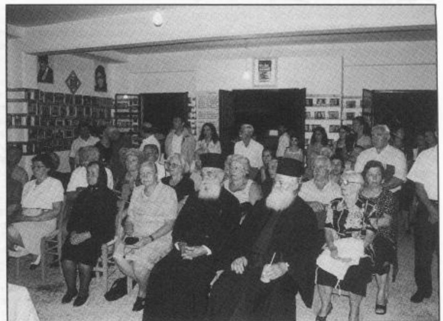
Από την παρουσίαση του βιβλίου στην βιβλιοθήκη.

1952-2002 - 50 ΧΡΟΝΙΑ - ΣΥΛΛΟΓΟΣ ΤΩΝ ΑΠΑΝΤΑΧΟΥ ΜΗΛΙΩΤΩΝ ΗΛΕΙΑΣ